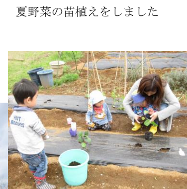
夏野菜の苗植えをしました