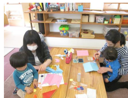
親子で鯉のぼりを作ったよ