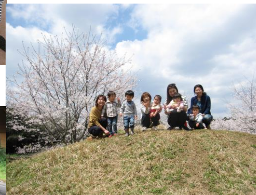
桜がとってもきれいだったね