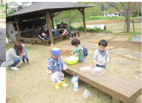
うちわでパタパタ