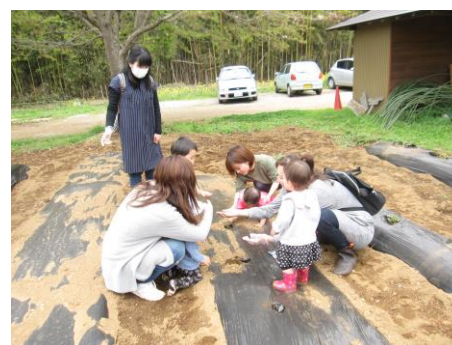
枝豆の種まきもしました