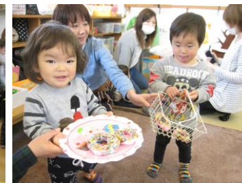
カラフル ドーナツおいしそう