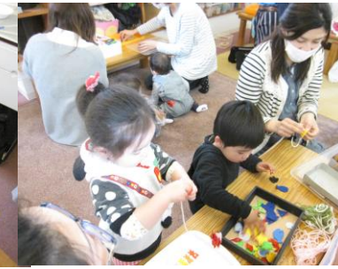
ひも通しを集中 アクセサリーの完成