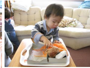
手作りトングを使ってスパゲティは大人気