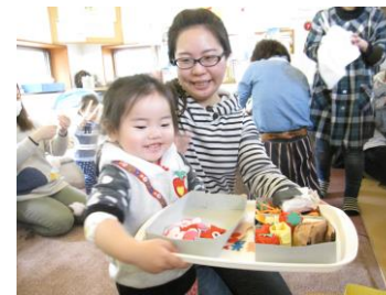
トレイにたくさん乗りました〜