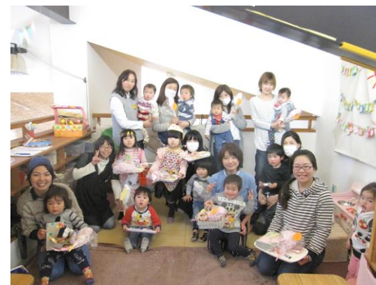
準備の御協力有難うございました。