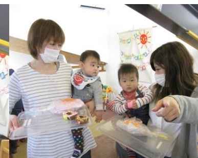
赤ちゃんも刺激を沢山受けました