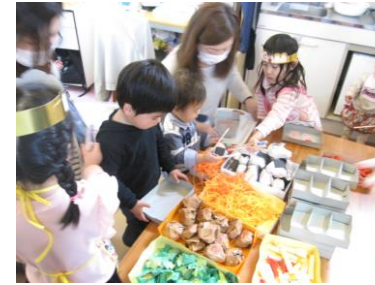
「お弁当どれにしようかなあ〜」