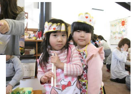
親子で楽しみながら準備をしてくれました