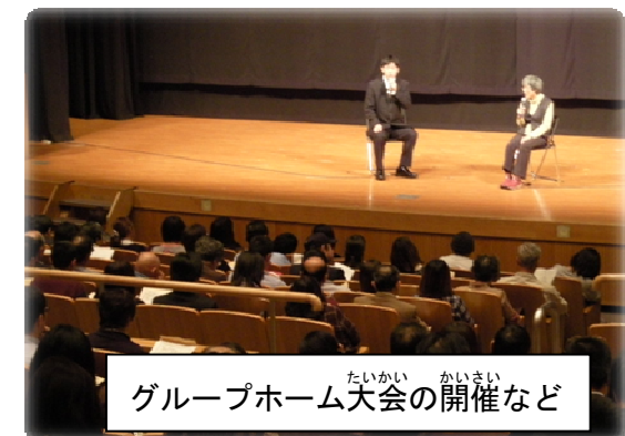
グループホーム大会の開催など