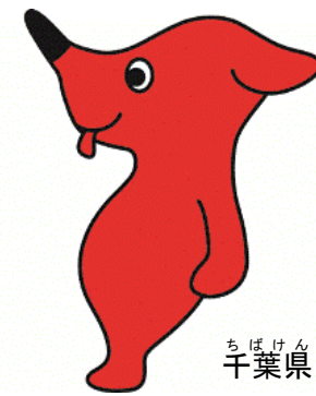
ちばけん 千葉県 マスコットキャラクター 「チーバくん」

へいせい 23 ねん 7 がつ せい 平成 23 年 7 月 作成 へいせい 28 ねん 4 がつ せい 平成 28 年 4 月 改訂