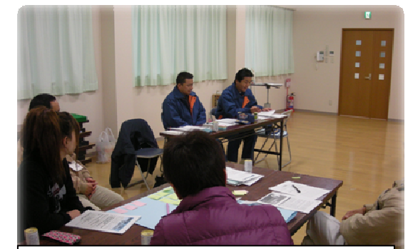
グループホーム職員向け勉強会など