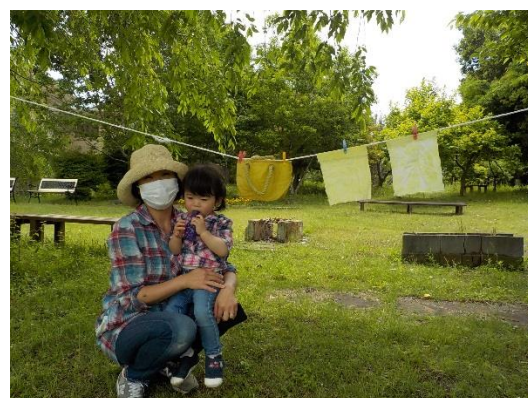
ハルジオンの花で染めました。

気になることの相談やほっとしたい時に利用して下さい。 午前中遊びに来られた時もお気軽にご相談下さい。