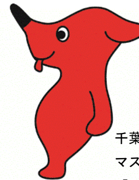
千葉県 マスコットキャラクター 「チーバくん」