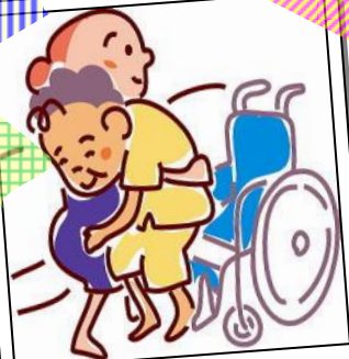
身体介護はお手の物♪