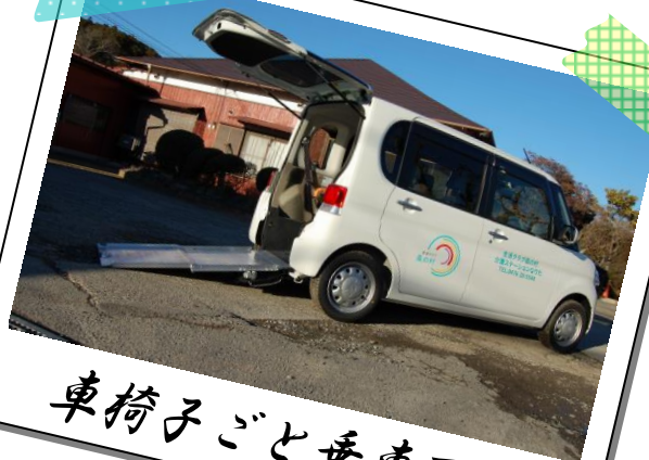
車椅子ごと乗車可能