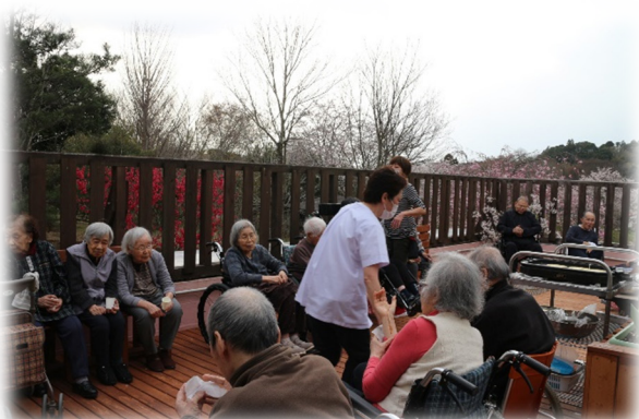
ウッドデッキでお茶会