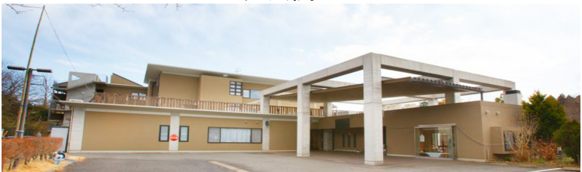
建物全容 お問合せ