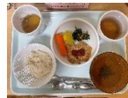
献立の例(完了期食)

・ごはん(五分づき米) ・わかめと水菜の澄まし汁 ・ミートローフ ・スティック人参 ・青菜の和え物 ・ローストポテト