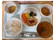
献立の例(完了期食)