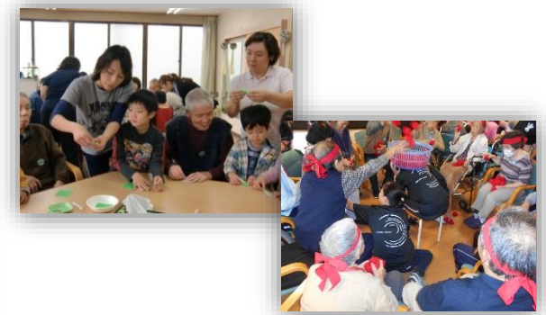
【レクリエーション】

塗り絵や歌、身体を使った白熱した対抗戦を行っています。季節ごとの行事も多数行っています。