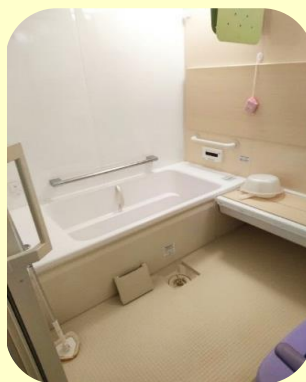
浴室(2ヶ所) お一人ずつ入れ る個浴タイプです ※お風呂に入って帰 りましょう