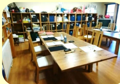
作業室兼 機能訓練室 ※体を動かしまし しょう!