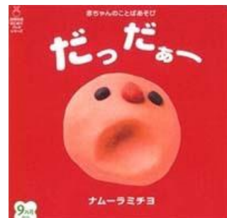
作: ナムーラミチヨ 出版社: 主婦の友社

この絵本は、「だっだぁー」「ぶっひゃっひゃー」「べっれー」等、不思議な擬音語の みが並びます。愛らしい粘土細工のキャラクターは作者の手作りで、左ページには 赤ちゃんの守り神の顔、右ページには赤ちゃんの表情豊かな顔があります。 作者のコラムに、愛を膨らませながら手指を使って「かわいい かわいい」と呟きなが らガーゼでふき取ったりして、作り上げるときはまるでお産婆さんになったような気持 ちだったとあります。(book.asahi.comより抜粋)