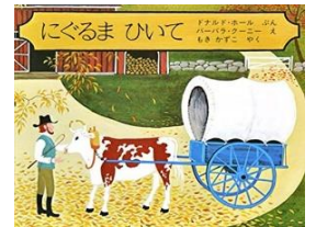
作 ドナルド・ホール 絵 バーバラ・クーニー 訳 もき かずこ

自然からの恵み、それを加工して手で”もの”を作り、他の必要な”もの”と交換する時代。 日々の生活に豊かさを感じる、そんな絵本をご紹介します。 秋、一年がかりで育て作りあげた作物、羊の毛で織ったショール、しらかばのほうき・・・ 全て、荷車に乗せ、牛に引かせ、お父さんは市場に売りに行きます。 空箱まで全て売り払い、最後には、荷車と牛も。 市場で役立つ道具とキャンディーを買い、家族の待つ家へ戻ります。 そして、又農場の一年が始まるのです。 バーバラ・クーニーの素敵な絵から、四季の移り変わりや家族の温かな暮らしが伝わってきます。 季節に応じた仕事をし、日々の営みを子供に見せる大切さを感じました。