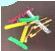
①モールやラッピングタイを2cmほどに切る

＜材料＞ペットボトル、モールやラッピングタイ、マグネット ビニールテープ、小さなビニール袋