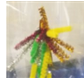
④ペットボトルにマグネットをくっつけてみよう！ きれいなお花が咲くよ！（青山）