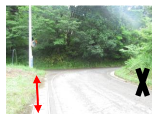
⑤ 急カーブあり。車道の幅狭く、見通しも悪い為、注意が必要。