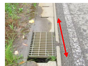
④ 側溝部分、穴が大きく開いている所が数ヶ所ある。足元に注意が必要。