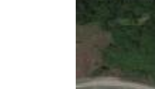
⑫ 叉路になっている。角で見通しが悪い。車が通るので気をつけて横断。