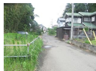
⑪ 住宅街。車の出入りに注意。声のボリューム気をつける。犬に注意。