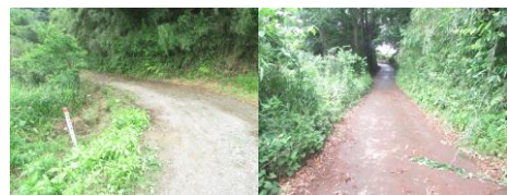
⑰、⑱ 細いカーブのある坂道。車1台が通るのがやっとである。通る前に必ず1名が坂上の様子を見に行