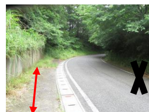
⑧ カーブの先見通しが悪い。葉の生い茂っている所毛虫が出ることもある。