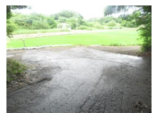
⑮ 急な下り坂降りてすぐ叉路。車が通る為注意。