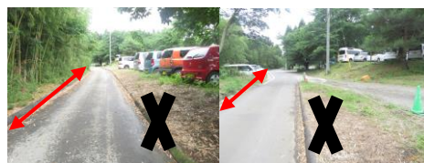
⑲ 特養ホーム前。車通り多い。急発進に注意。道が狭いので注意が必要。送迎の時間は特に多い。