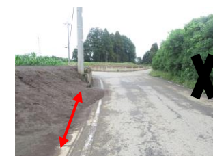
⑨ 道がとても狭い。叉路になっている為注意が必要。すみやかに曲がる。