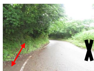
⑥ カーブが続いている。坂道でスピードを出す車がある為、注意が必要。