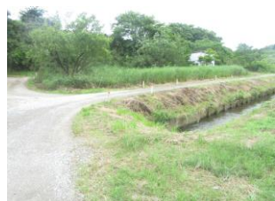
⑯ 疎水がある。川の中に転落しないように注意が必要。