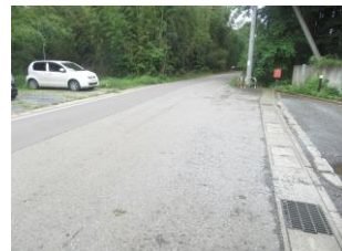
⑳ 車通りが多い。特養の駐車場からも出入りがある為、横断する時注意。