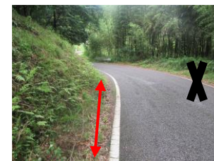
③ カーブになっており見通しが悪い。白線少ない為なるべく内側を歩く。