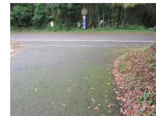
② 坂道を下ってすぐ車通りが激しい道の為、注意必要。コケあり転倒注意。