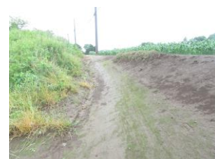
⑩ 畑の道。畑に入らない様に注意。場合により奥で水分補給させてもらう。