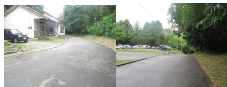
① ロッジ、ブランコ前、保育園駐車場。車の出入りや急発進の恐れがある。郵便車、ごみ収集車などが通る。

※道路交通法に従って歩く。基本は右側通行。③～⑨、⑲は危険がある為決められた場所を歩く。