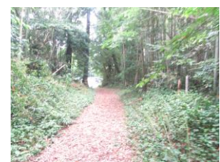
㉑ トトロの道。蜂、蛇などが出ること、竹が倒れていることがある為注意。