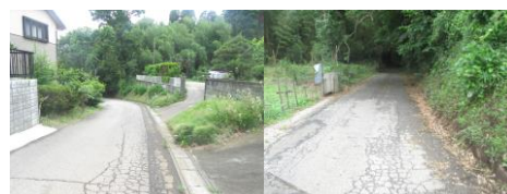
⑭ 住宅がある。車の出入りに注意。急な下り坂、砂利で滑りやすいので手をつながない。車通る為注意。