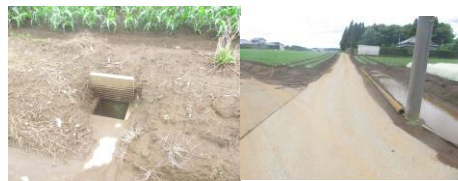
⑯とても狭い。車とすれ違う時は畑の脇に入る。畑の水路が開いている事、水が溜まっている事がある為注意。