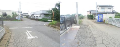
⑭車通りが激しい道路。余裕を持ち横断することができるように前後左右を確認する。工場車の出入り注意。