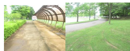
㉒歩道がない、狭い場所は、芝の上や駐輪場の間を歩くようにする。道路のそばでは遊ばない。