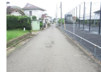
⑦住宅街。直線的であるが、急な車の発進に注意が必要。