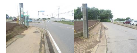
⑱曲がり角に電話ボックスがあり歩道が狭くなっている為注意。コンビニがあり、車の出入り多い為注意。