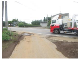
⑰大通りに出る。車のスピード早い為注意。歩道の内側を必ず歩く。