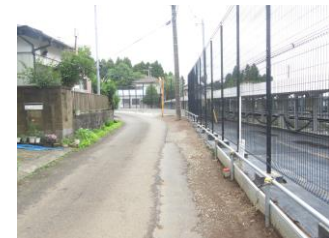
⑤道の先がカーブになっており見通しが悪い為、注意が必要。