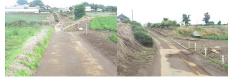
⑮へびの道。とても狭い。車が来るとすれ違えない為、畑のわきによける。坂の先が見通し悪い為、注意。