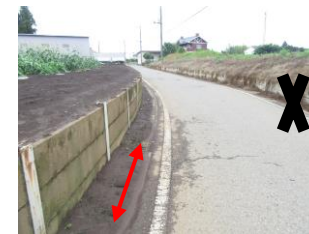
①カーブになっており見通しが悪い。道がとても狭い為注意が必要。