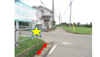
③交通量の多い道路。星側にカーブがあり、見通しが悪い為職員が立つ。横断する際は速やかに横断する。