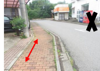
⑪歩道が広がっている為、オレンジの歩道の内側を歩く。