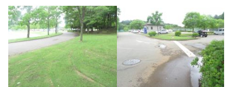
㉑トイレまで行く際もできるだけ芝の上を通る。横断する際には車に注意する。