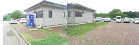
⑳トイレ周りは駐車場になっている為、車の急発進に注意する。