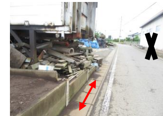
②トラックや廃材などが置いてある。鉄くずや釘があるので注意する。