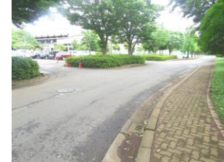
⑲スポーツプラザ内は歩道の上を歩く。