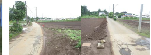
④とても細い道だが車もすれちがう。車が来たらできる限り畑に寄る。畑に入らない様注意。