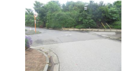
⑫又路になっている。車通りがある為、速やかに横断する。