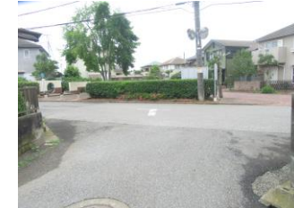
⑨三角形の公園手前。こどもの飛び出しに注意する。車通りが多い。