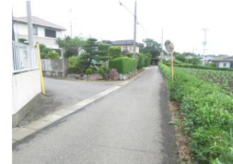
⑧曲り角。カーブミラーがあるが見通しが悪い為、注意が必要。