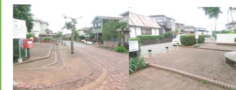
⑩公園内。道路との境目は縁石になっているが、高さがあまりないので急な子どもの飛び出しや車の発進に注意。