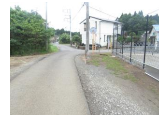
⑥又路になっているので注意が必要。道が細い為車が来たら砂利道に入る。