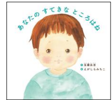
作: 玉置永吉 絵: えがしらみちこ

あなたの すてきな ところはね 『ねえねえ きいて!』ってのはなす はずんだこえ。 おしえてくれる あなたのせかい、いつも たのしみに しているのよ。きょうも たくさん きかせてね。 (中略) そして なにより、あなたの すてきな ところはね あなたが きょう ここにいる っていうこと。 ほかに は なんにも なくたって、ほんとに ほんとに すごいんだがら。 なにが あっても わすれないで。 うれしいときも かなしいときも しっぱいしちゃって たちどまっても、あなたは とっても すてきなひと。 あしたからも ずーっとね。 ここにいてくれて ありがとう。