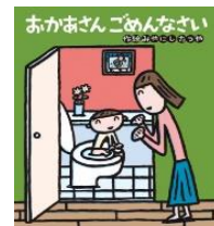
作・絵 みやにし たつや