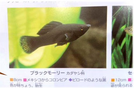
ブラックモーリー カダヤシ科 セ 8cm ■メキシコからコロンビア ◆ピロードのような黒 12cm ■ 色が特ちょう。胎生 姿が見られる